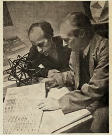
KURT JOOSS Y RUDOLF LABAN, EN 1920

Las primeras figuras de esta búsqueda de aclarar una modalidad de tipo individual que, más que nada, descansaba en la intuición, en la espontaneidad de la improvisación. Era una necesidad histórica: la más