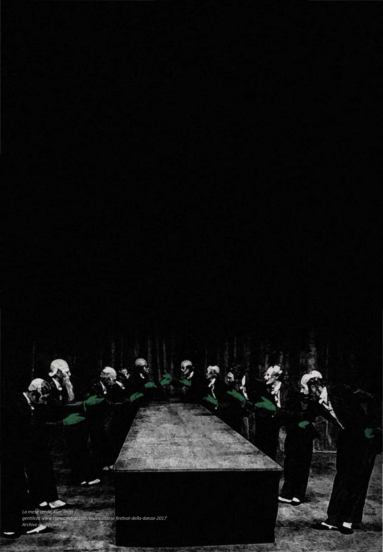
La mesa verde. Kurt Jooss / gentileza www.romecentral.com/en/equilibrio-festival-della-danza-2017 Archivo modificado