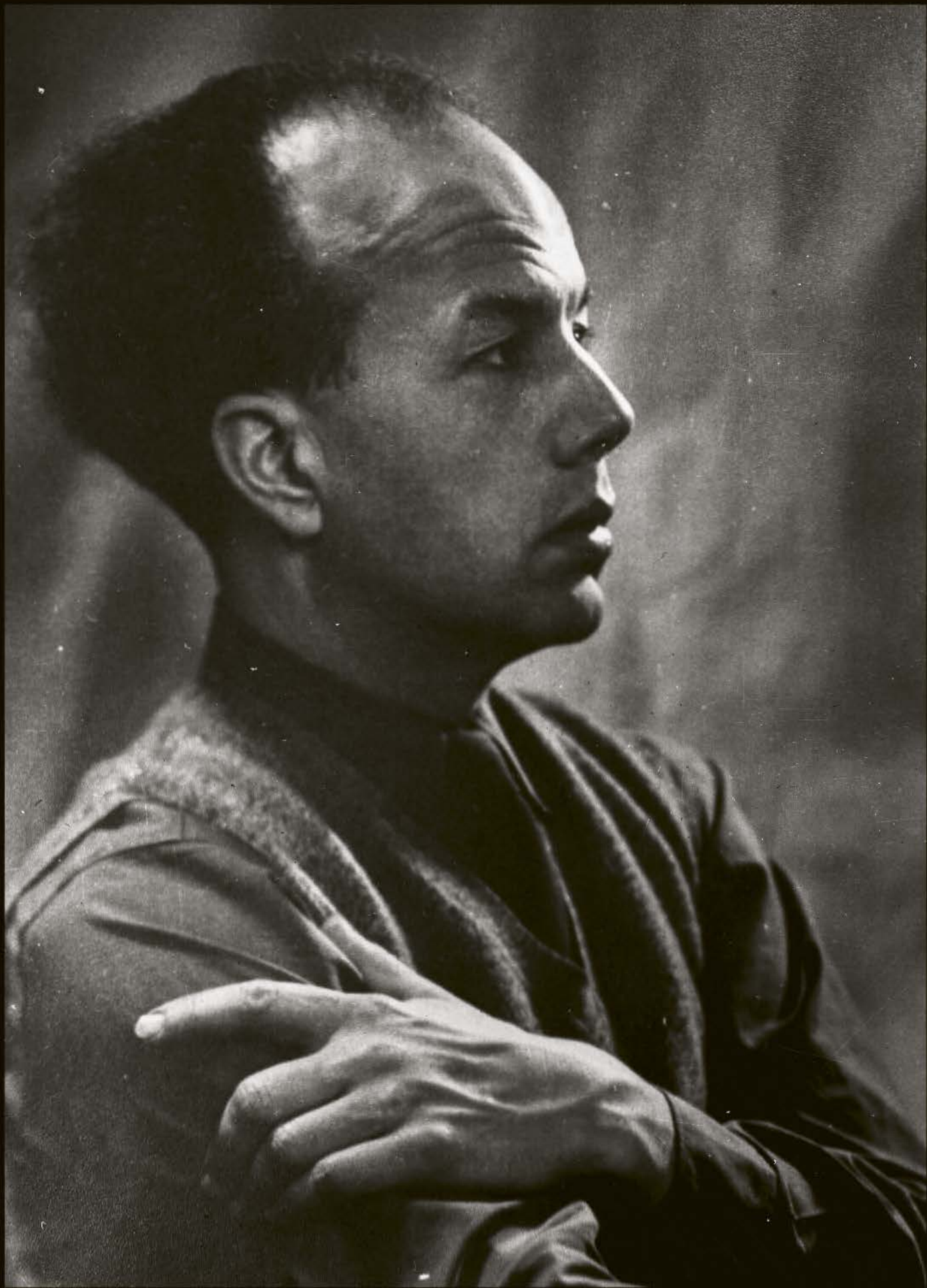
Retrato de Kurt Jooss. Ca. 1950.