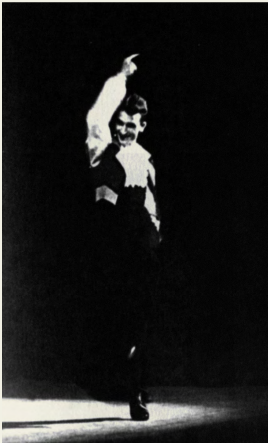
Instituto del Teatro Barcelona, 1948