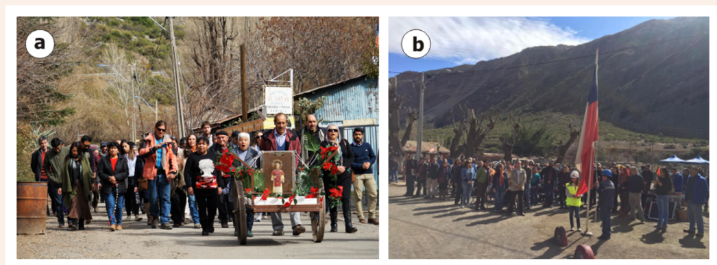
FIGURA 4. Fotografías celebración día del minero de 2019. a: Procesión de San Lorenzo; b: acto. público

Por último, hemos notado que la dimensión inmaterial alcanza otras vertientes que se pueden documentar, como historias, relación con arrieros, actividades recreacionales, entre otras.