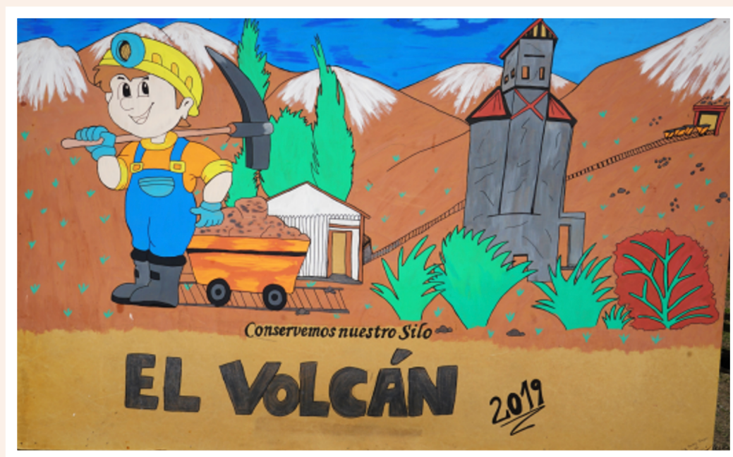
FIGURA 3. Pintura presentada en el día del minero de 2019, fotografía de Cristóbal Estay (Fundeso), cedida.

Finalmente, el carácter de patrimonio cultural del silo se consagra debido a la defensa que los habitantes de la localidad hicieron para evitar que se llevara a cabo su demolición, permiso solicitado por los dueños dos veces al municipio. Esto motivó mayores estudios y se constató, como defensa suficiente, que al silo llegaba un ramal de ferrocarriles para cargar carros antes de bajarlos por la vía principal, y como todo el recorrido de F.F.CC. Puente Alto - El Volcán está considerado monumento histórico 55 , quedó protegido también el silo. Además, constituye una estructura ícono del poblado, usado en sus representaciones gráficas, artísticas (e.g. Fig. 3) e incluso oficiales, como en el timbre de la junta de vecinos de la localidad donde está inserto.