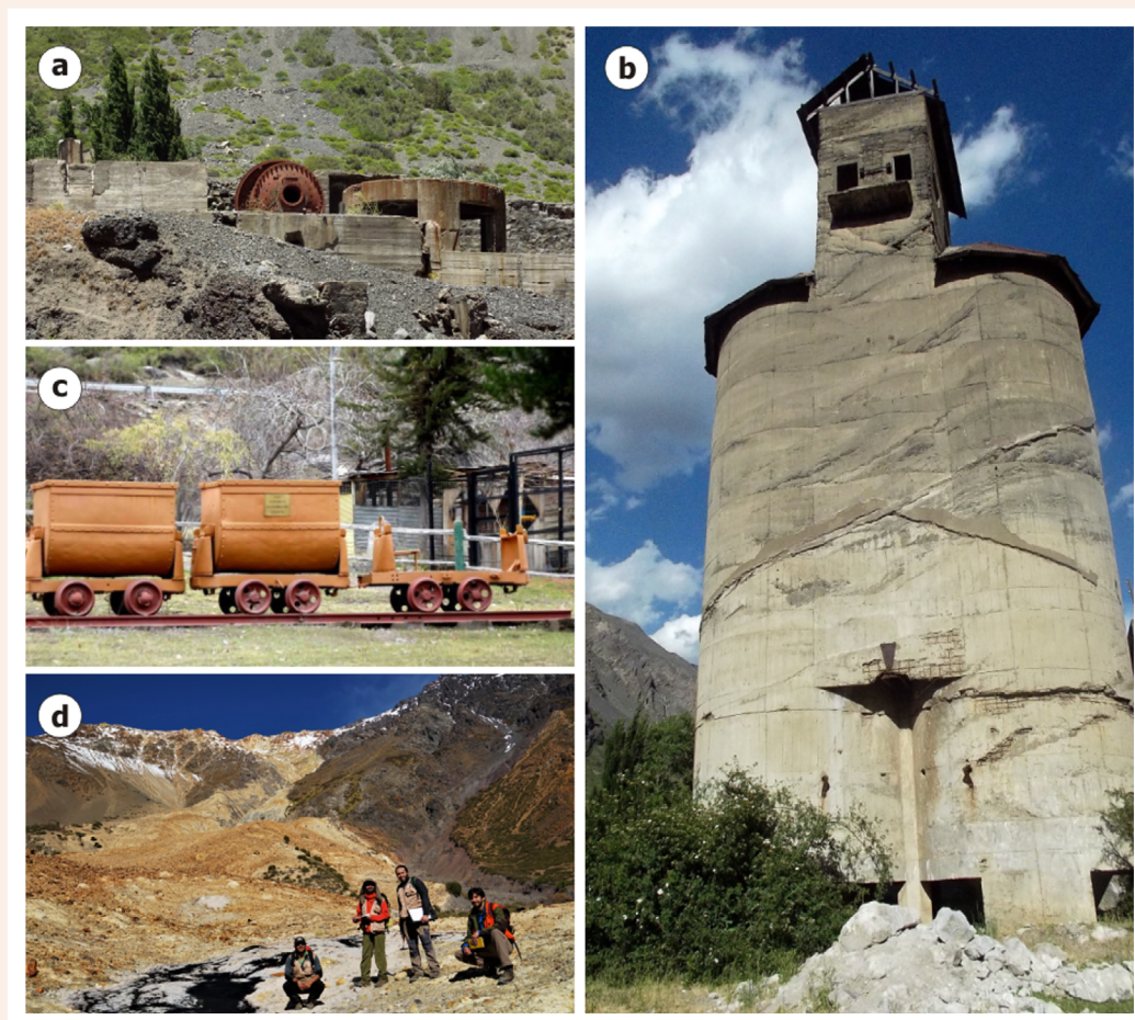
FIGURA 2. Distintos tipos de patrimonio, según categorías de la Unesco: a y b: patrimonio cultural inmueble (plantas de cobre y yeso resp.); c: patrimonio cultural mueble (cubiles); d: patrimonio natural (las Amarillas).

Con la industrialización, la planta llegó a ser la segunda en importancia a nivel nacional en 1903, y se mantuvo dentro de las ocho más importantes hasta 1913. Ya hacia mediados de siglo, pese a los vaivenes de la industria, era reconocido como parte de uno de los conglomerados mineros de importancia, junto con El Teniente y El Chivato 35 .