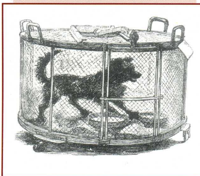
Perro vacunado por Pasteur

Como ya hemos visto, fue Pasteur quién inició el estudio etiológico y patológico de la acción de los microorganismos comenzando en el campo animal, sólo aplicando a las enfermedades humanas el conocimiento adquirido con las enfermedades de los animales